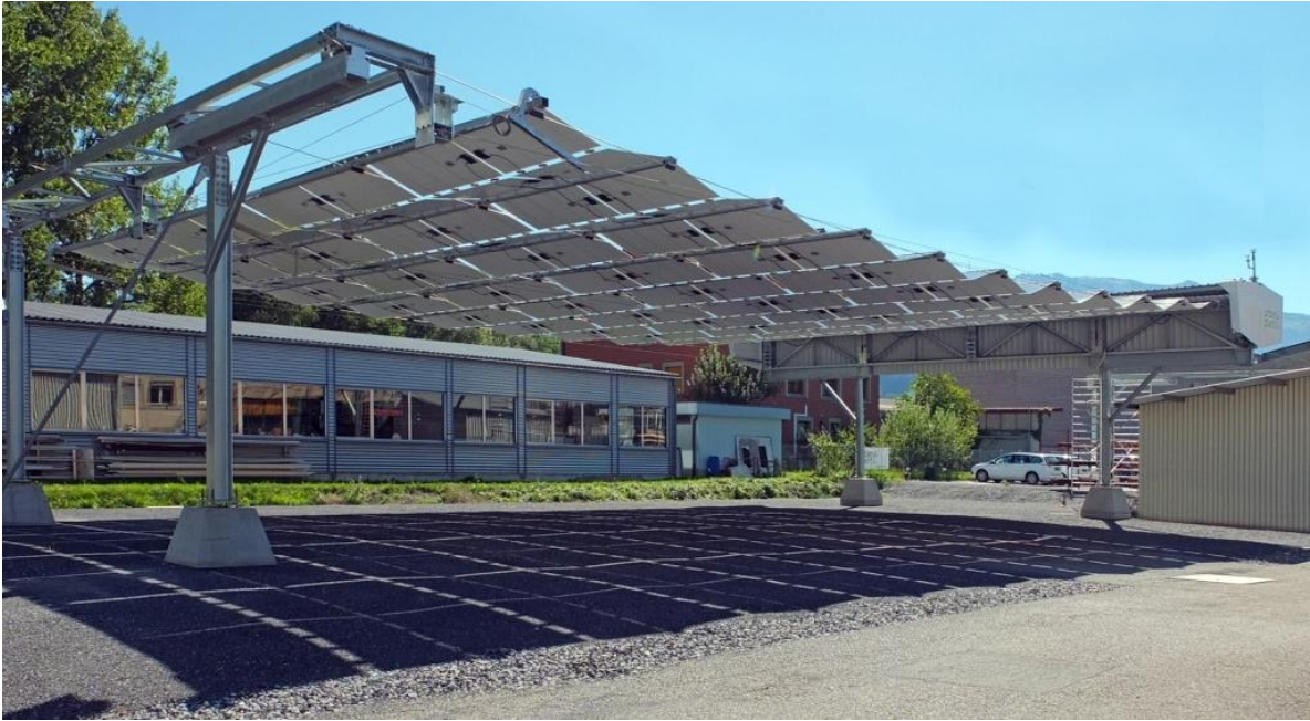
Demonstrationsanlage der LE-Light Energy Systems AG in Balzers